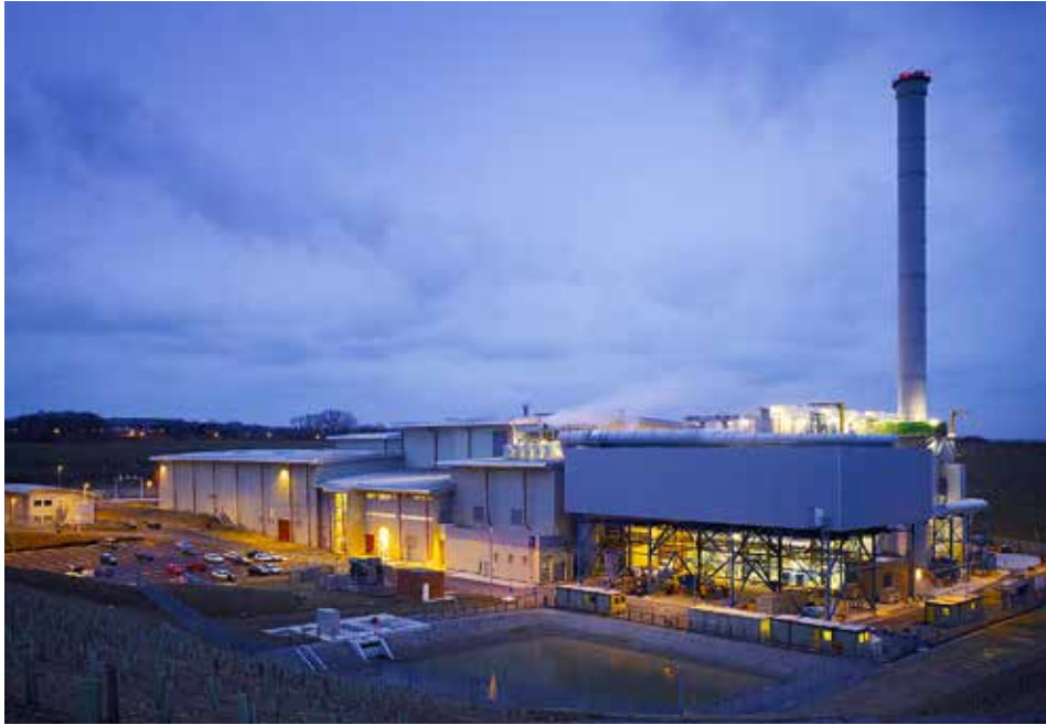
Usine d'incinération des déchets ménagers d'Allington

Dans le domaine de la dette d'infrastructure, il y a une multitude de possibilités d'investissement qui remplissent des critères écologiques ou sociaux et qui sont aujourd'hui sur toutes les lèvres, comme participer à des projets dans les énergies renouvelables ou promouvoir la construction de logements sociaux. Nous